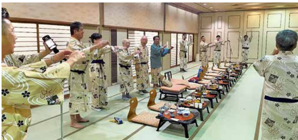
合唱「手に手をつないで」